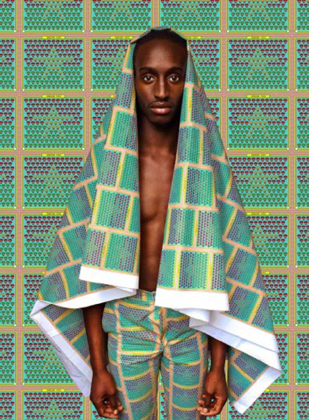
PIERRE-CHRISTOPHE GAM The Resurrection Série Sankara, L'homme intègre 2017