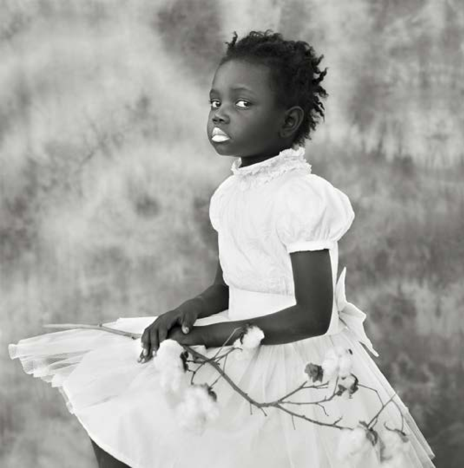
FABRICE MONTEIRO Ninny Série The Eight-Mile Wall 2017